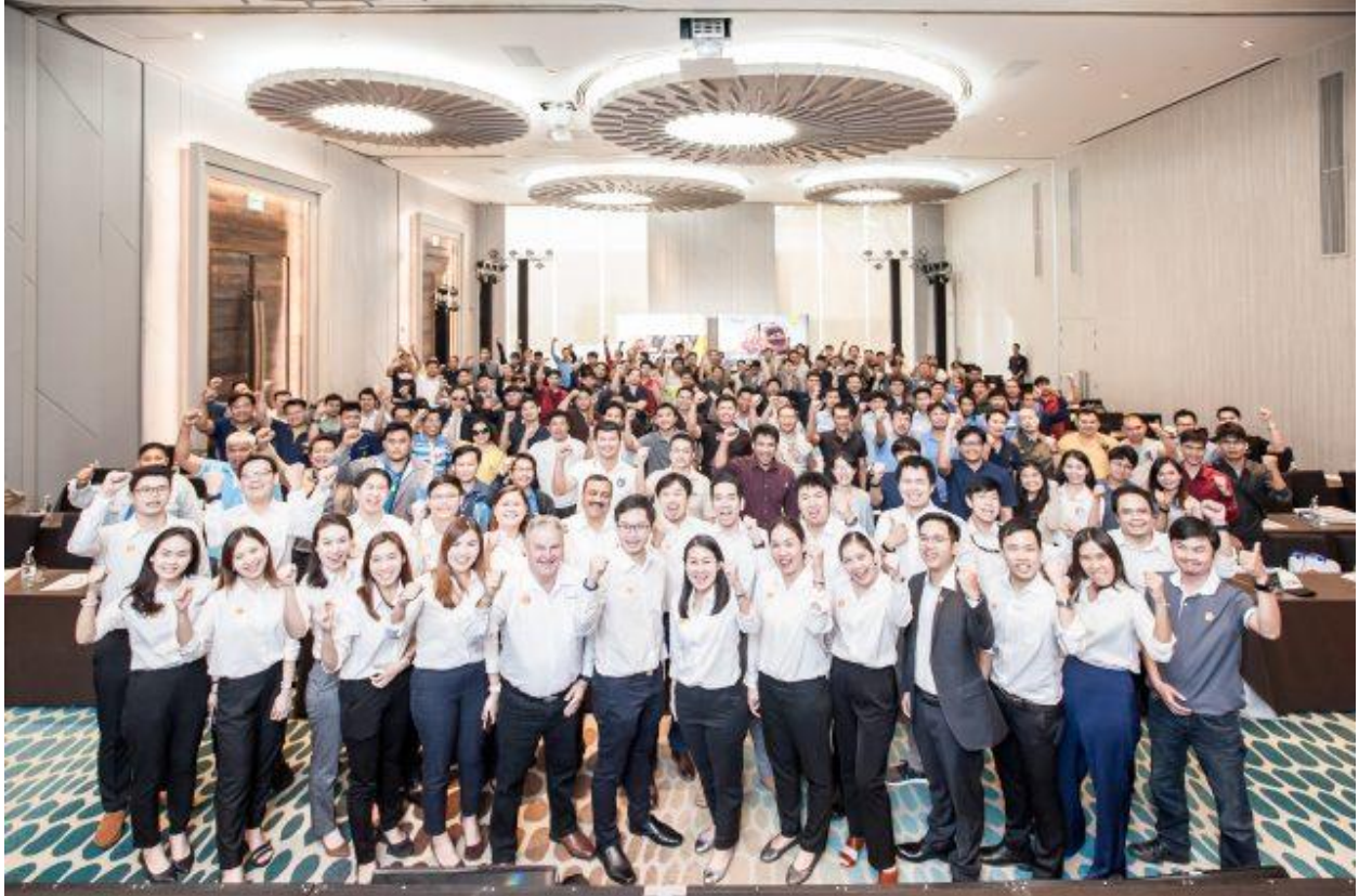
พนักงานเชลล์ จากประเทศไทย ออสเตรเลีย อินเดีย และฟิลิปปินส์ วิศวกร ผู้จัดการโรงงาน และผู้บริหารจากบริษัทน้ำตาลชั้นนำ กว่า 150 ท่าน ที่เข้าร่วมงาน สัมมนา “ก้าวสู่ความสำเร็จในอุตสาหกรรมน้ำตาล เพื่อการเติบโตธุรกิจที่ยั่งยืน”