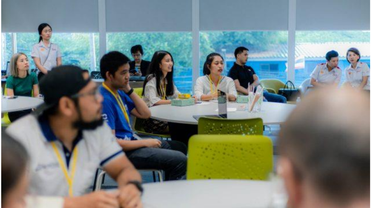
บรรยากาศภายในงานวัน Bootcamp day