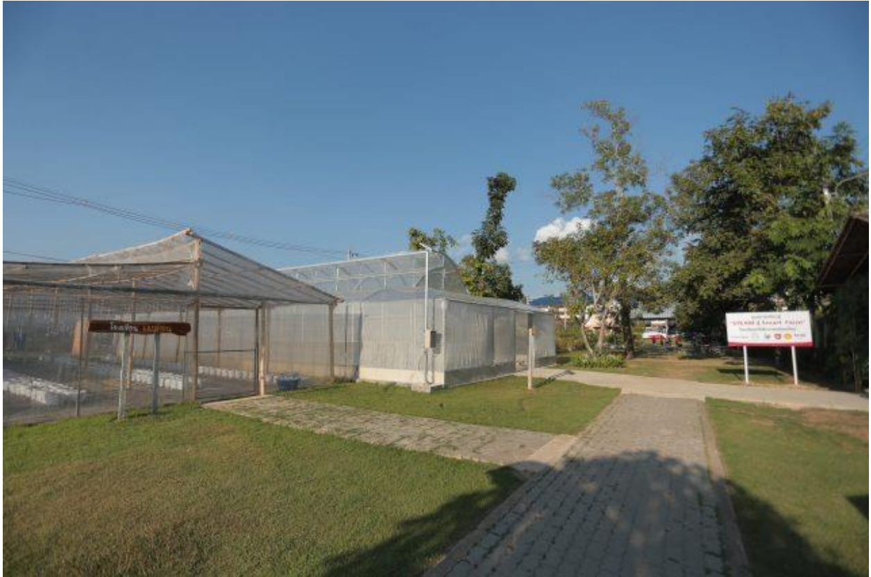
ศูนย์การเรียนรู้การเกษตรแบบอัจฉริยะ “Steam สู่ Smart Farm” ณ โรงเรียนศรีวังาลัยเชียงใหม่ ในสังกัดของโครงการเซลล์เต็มสุข