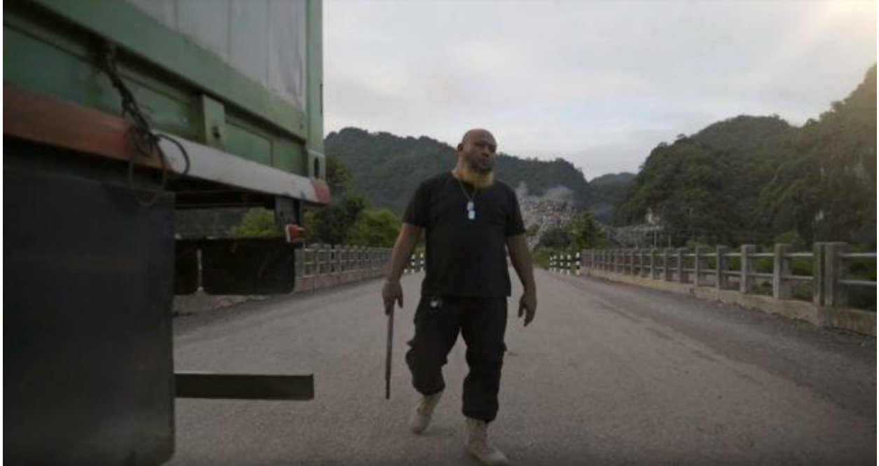
ผู้ขับรถบรรทุกตรวจสอบสภาพรถก่อนออกเดินทาง